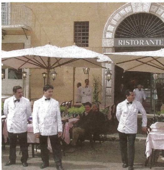
LOCALI Molti i locali (pure trattorie, osterie, pizzerie, birrerie, agriturismi, residence e alberghi) che pagheranno una tassa rifiuti ridotta